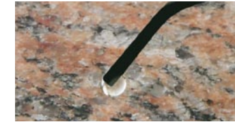
StoneLux Transpa flow per l'effetto camaleontico