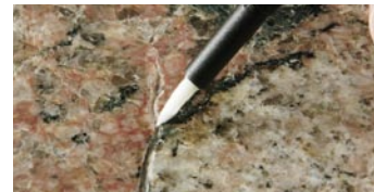
applicare il primer