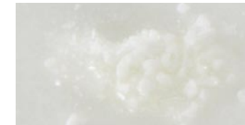
StoneLux Cristalli creano strutture