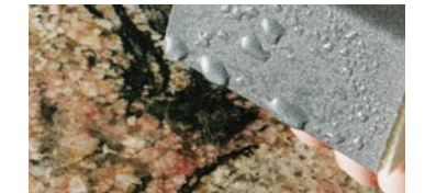
levigare ad umido