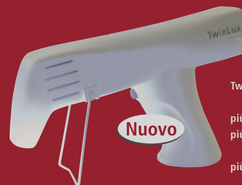
TwinLux Luce LED doppia