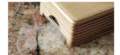
asportare il materiale in eccesso

Risultato: Riparazione perfetta della superficie difettosa senza danneggiare le zone circostanti.