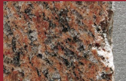
Anche i difetti sui bordi – interni o esterni – si possono riparare con semplicità ma in modo definitivo

StoneLux è il primo sistema integrato al mondo che, permette di effettuare riparazioni su tutte le pietre naturali lucidabili e agglomerati. I risultati sono sempre efficaci in termini di durata e di impatto visivo. (pietre usate sia all'interno che all'esterno)