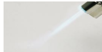
in più per marmo o pietra calcarea fiammeggiare (creare lo strato SiOx)